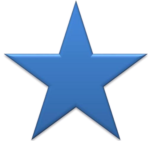
Рисунок 4. «Звезда» с количественным показателем.