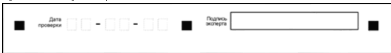
Рис. 2. Область для проставления даты проверки и подписи эксперта ПК

б) передать рабочий комплект эксперта ПК председателю ПК для передачи на обработку.